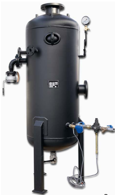
Рисунок носит указательный характер